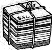
●チ ラ シ