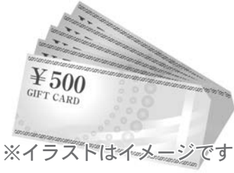
※イラストはイメージです

プレミアム付商品券とは、額面以上の割り増し金（プレミアム）が付いた商品券のことで、「商品券の購入価格以上の買い物ができる」ことが特徴です。消費税の引き上げが家計に与える影響を緩和するとともに、地域の消費を下支えすることを目的としています。