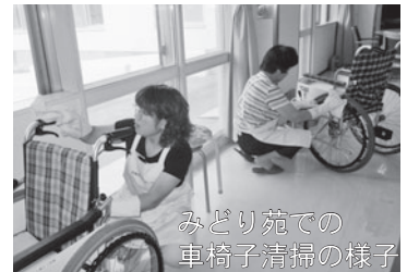
みどり苑での 車椅子清掃の様子