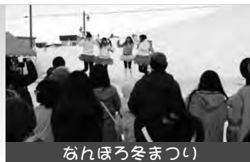
なんぼろ冬まつり

なんぼろの地元アイドル「南幌町特産品少女Speciality Girls」が「2016なんぼろ冬まつり」と、「さっぽろ雪まつり」に登場し、訪れた多くの人々の前で「なんと!なんぼろ」を披露しました。