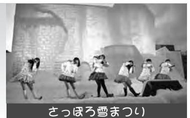
さっぽろ雪まつり