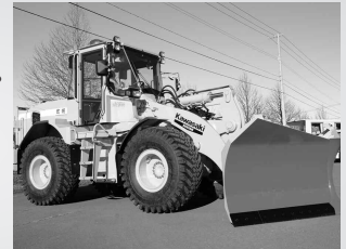
新たな除雪車を導入！