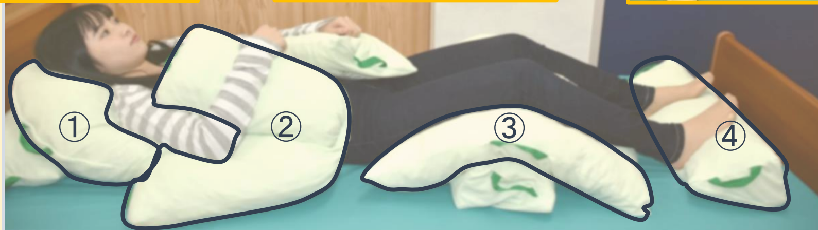
4種類のクッションを使用