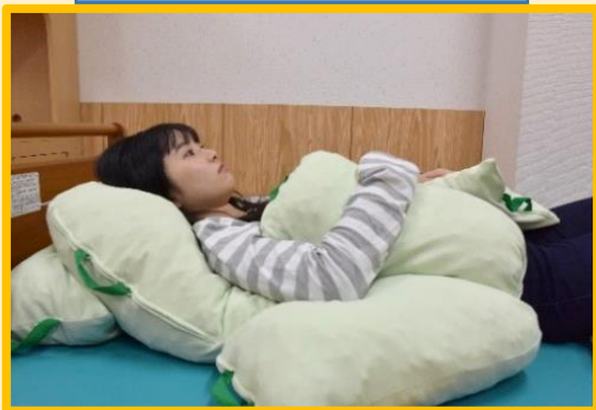
5種類のクッションを使用