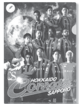
日本ハムファイターズ 北海道コンサドーレ札幌