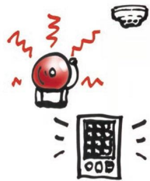
自動火災報知設備