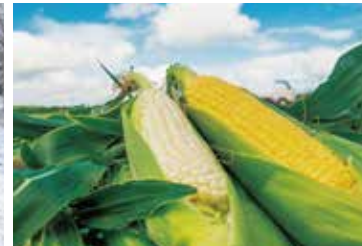
地元の特産品、野菜が盛りだくさん！