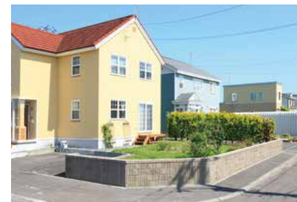
ゆったりとした区画。家づくりや庭づくりにこだわることができます。

子育て世代の一戸建て購入を後押しするため、住宅・土地の取得費用を助成。また、空き家・空き地情報バンクを開設し、情報を集約、提供しています。