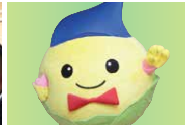
キャベッチくんもお待ちしています。