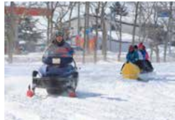
季節のお祭りが町を盛り上げます。