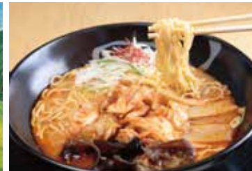
町を代表するグルメもいっぱい！