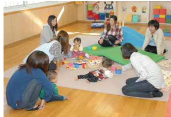
「子育て支援センター」は、親子で遊びに来たり、ママづくりの場としても利用されています。

助成支援制度に加えて、心と体を育てる取り組みもたくさん。 絵本をプレゼントする「ブックスタート」や「中学生国際留学プログラム」、多彩なスポーツ・体験教室などを実施しています。 また、特定不妊治療の治療費の一部助成も行っています。パパ・ママを応援する「子育てサポーター」も活躍しています。