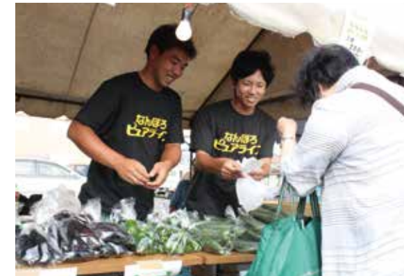
若手農業者も町内外で積極的に活動。イベント企画や野菜の直売も行っています。

広くて平らな地形と、市場や消費地への近さ。南幌の農業は、町にはもちろん、周辺の都市にも重要な存在です。 自分のお店を持ちたいという方への起業サポートもあります。