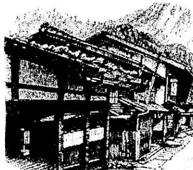
妻 籠 宿