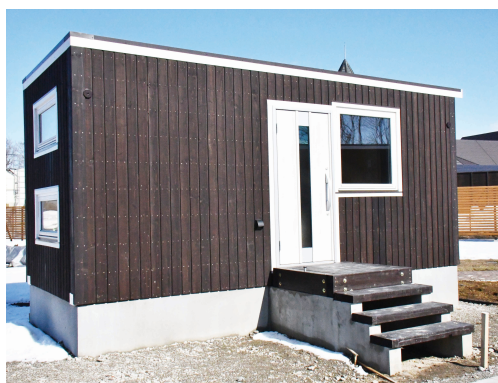
キャンプ場に建設されたキャビン

○ 都市整備課長 現地業務説明会には4社出席しましたが、申請は1社となっています。