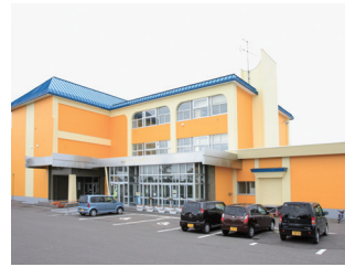
生涯学習センターぼろろ