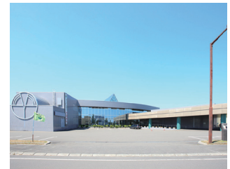
保健福祉総合センターあいくる