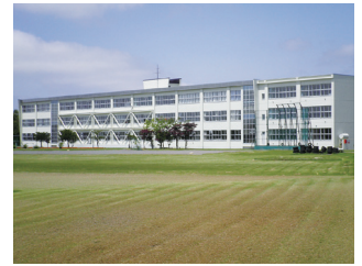
南幌町立南幌中学校