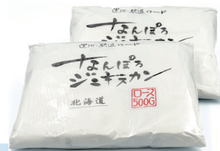
なんぼろジングスカン