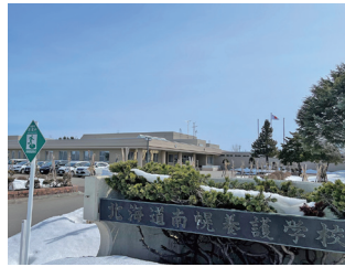
北海道南幌養護学校