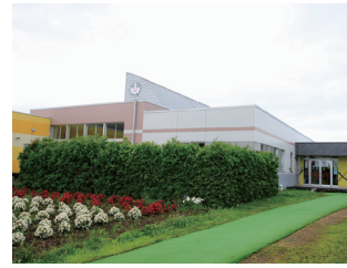
南幌みどり野幼稚園