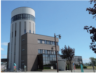
ふるさと物産館ビューロー