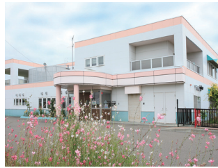
南幌いちい保育園