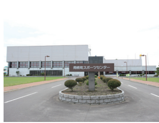
南幌町スポーツセンター