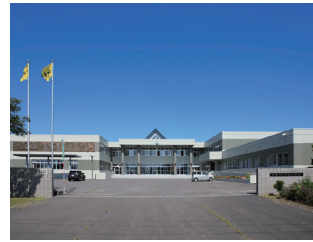
南幌町立南幌小学校