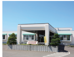
特別老人ホーム南幌みどり苑