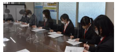
企業訪問による取材を実施しました