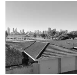
※ヨウン先生の出身地 オーストラリア パースの街並み

☆Q&Aコーナー☆ Q・日本に来たことがありましたか? A・1度だけ、旅行で大阪や東京を5週間観光しました。 Q・今回来日を決めた理由はなんですか? A・私と妻は日本の文化や生活がとても好きです。日本の多くの人はずっと周りを思いやる心を持っていて、学ぶべき教訓がたくさんあると思うからです。